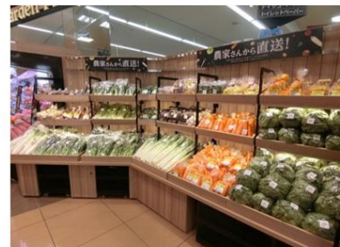
【農家さんから直送！コーナー】