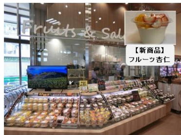
【フレッシュサラダ&カットフルーツコーナー】