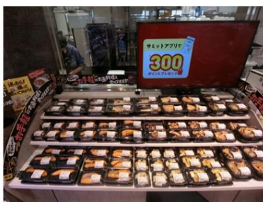
【煮魚・焼魚コーナー】