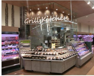
【グリルキッチンコーナー】