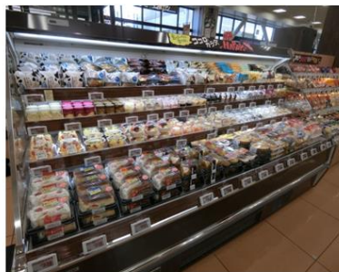
【フレッシュデザートコーナー】