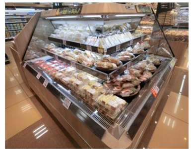
【冷蔵サンドイッチ売場】