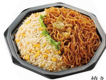
焼きそば&チャーハン