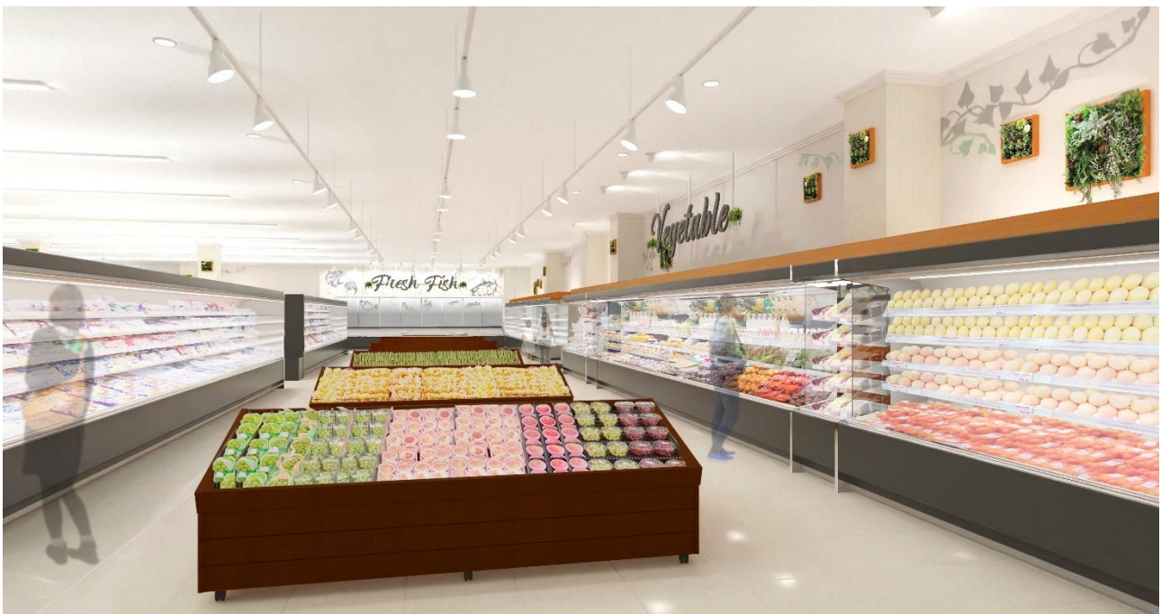
△船橋法典店 改装後の内装イメージ

2023年6月29日(木)、株式会社東武ストア(本社:東京都板橋区、代表取締役社長:木村吉延)は、JR 武蔵野線 船橋法典駅 駅前の東武ストア「船橋法典店」(千葉県船橋市)を改装オープンします。