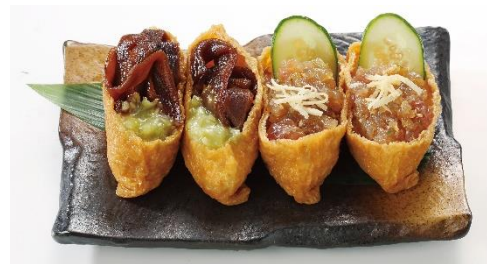
(左) わさびかんぴょう (右) ごま醤油マグロ