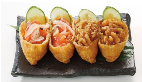
(左) スモークサーモン (右) くるみ

さっぱりとした味付けされた刺身や野菜と組み合わせることで、おいしさと健康を考えた商品ラインナップとなっています。