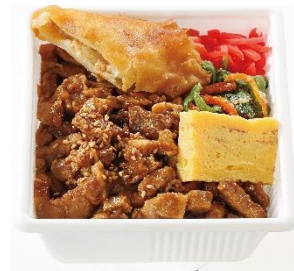
プチガバオライス