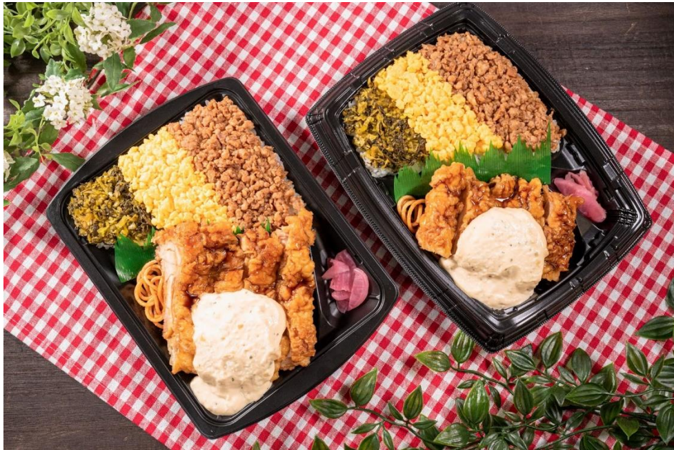
左：新商品 右：従来品

株式会社ファミリーマート（本社：東京都港区、代表取締役社長：細見研介）は、継続して取り組んでいる 5つのキーワードの1つである「たのしいおトク」 の一環として、プライベートブランド「ファミマル KITCHEN」から人気弁当「3色そばろ&チキン南蛮弁当」526円（税込568円）を期間限定でボリュームアップして、2023年6月20日（火）から全国のファミリーマート約16,500店にて発売いたします。