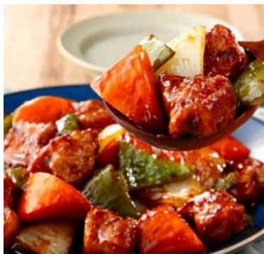
ミールキット 肉うま! 国産豚肩ロースと国産 野菜の黒酢豚 2人前【冷蔵】 2人前 (499円/人前) 998円 (税込¥1,078円)