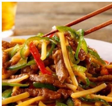
ミールキット 肉うま! シャキシャキ彩り野菜の 牛肉チンジャオロース2人前【冷蔵】 2人前 (590円 /人前) 1, 180円 (税込1, 275円)

料理に必要な食材がセットになった便利な商品です。忙しい日にさっと使える商品も豊富で、レシピと食材と一緒にあったミールキットは時短に便利な商品です。社内でも試食モニタリングを行い、味の確認を経て商品化をしています。当日カットしたお肉のみに野菜をセットアップしたお肉の鮮度を重視した商品も揃えています。