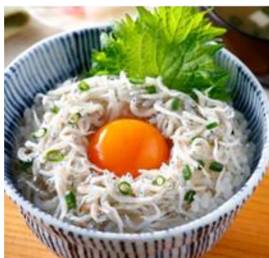
【冷凍】森水産 愛媛産 釜あげ姫様しらす 25g×10 1, 480円 (税込1, 599円)

時間に余裕を持ちたいときに、簡単に調理できる冷凍食品もバリエーション豊かにご用意しています。「今晚のおかずにもう一品ほしい」そんなときに食卓を彩ってくれます。お弁当のメニューにも取り入れることができるので、常備しておきたいアイテムの一つです。調理時間の短縮にもなるため、忙しい日の食事にも最適です。鮮度がよい旬のお魚をそのまま冷凍した刺身の提供など業界最大規模の約2,000品目の品揃えを予定しています。