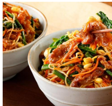
ミールキット 肉うま! コク深い野菜たっぷり ビビンバ丼の具 2人前【冷蔵】 2人前 (499円 /人前) 998円 (税込1, 078円)