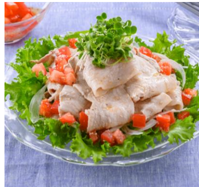
【冷凍】旭食肉協同組合 千葉いもぶたバラうす切り 300g 1, 014円 (税込1, 096円)