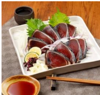
【冷凍】高知県加工100% 国産薬で焼いたかつおたたき 1節 300g 1, 780円 (税込1, 923円)