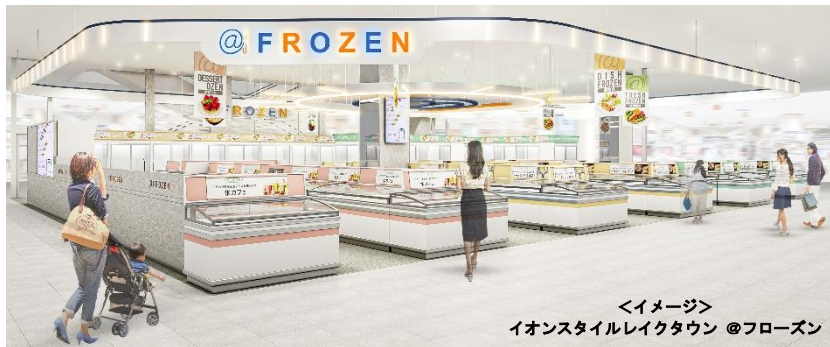
<イメージ> イオンスタイルレイクタウン @フローズン

当社は今年度、上記2店舗を含め「@フローズン」を首都圏中心に新たに5店舗出店し、簡便・時短という価値に加え“食の豊かさとおいしさ”をより多くのお客さまへ提案するため、冷凍食品専門店事業を本格的に拡大してまいります。