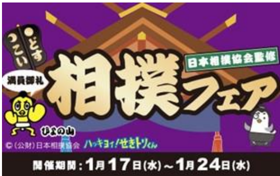
▲相撲フェア キービジュアル