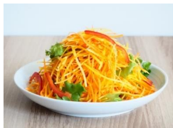
<旬を味わうサラダ 金美人参ミックス>

「旬を味わうサラダ 金美人参ミックス」は、季節を感じられる野菜を使用した2～3人前「旬を味わうサラダ」シリーズの期間限定商品です。「旬の野菜をおいしい時期に食べていただきたい」という想いで開発しました。冬から春にかけて旬を迎える国産の“金美人参”をメインに、人参、グリーンリーフレタス、赤パプリカなど、配合野菜を全て緑黄色野菜で仕立てました。また、商品パッケージには栄養素をアイコンで表記しております。栄養バランスを考慮して商品を選びたいお客様に大変好評いただいています。※1