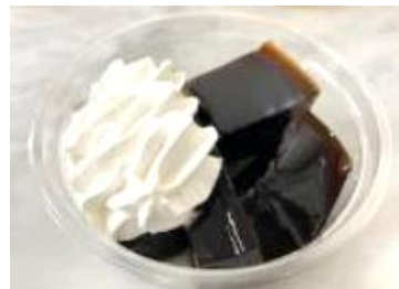
ブラック珈琲ゼリー（コーヒーホイップ添え）