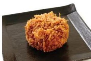
タスマニアビーフのメンチカツ