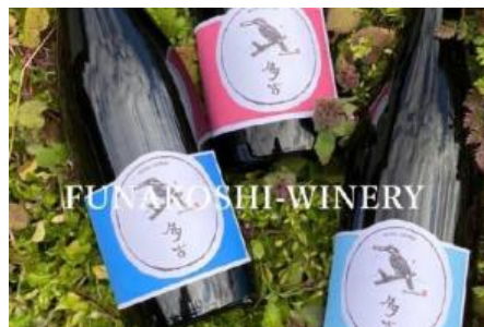
船越ワイナリーのワイン