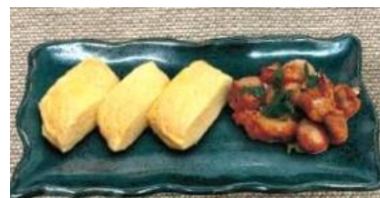
だし巻玉子とおつまみチキン