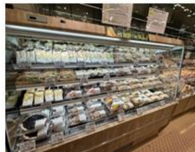
冷蔵サンドイッチも充実の品揃え