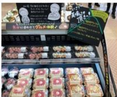
総菜売場のローストビーフ丼