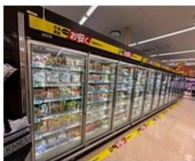
品揃えが拡大した冷凍食品売場

お菓子売場では、「駄菓子」「グミ」等のお子様に人気の商品を豊富に品揃えし、また当店で支持されている「かりんとう」や「洋風焼き菓子」などの売場スペースを拡大します。