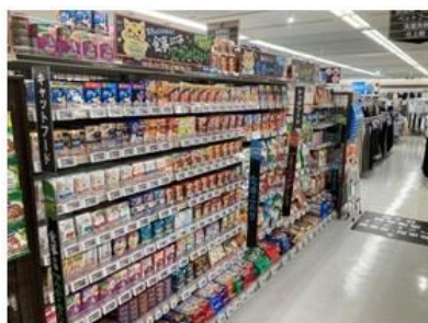
品揃えが拡大した「ペットフード」

家庭用品と合わせて購入しやすい商品を販売するほか、駅至近店舗の特性に対応する商品を拡大します。また、リニューアルに合わせて営業時間が 9 時から 22 時に変更になりました。