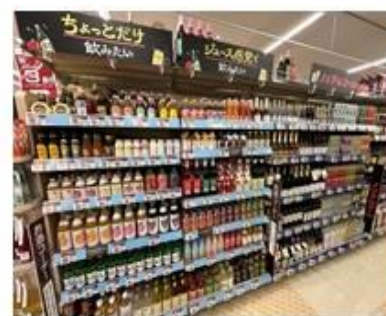
選ぶ楽しみのあるお酒売場