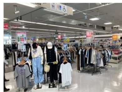
衣料館「コルモピア」