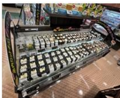
「店内カットチーズ」コーナー