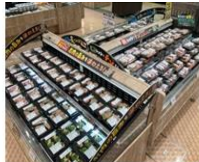
レンジアップ味付肉コーナー