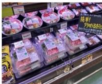
調理が簡単な「ミールキット」