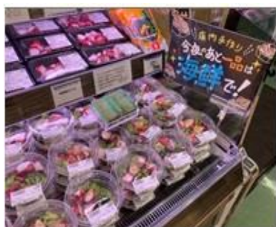
鮮魚売場の「店内手作りおつまみ」

総菜売場では洋風冷蔵米飯コーナーを新設し、ローストビーフ丼やアボカドが入った海鮮ユッケ丼を新たに販売します。