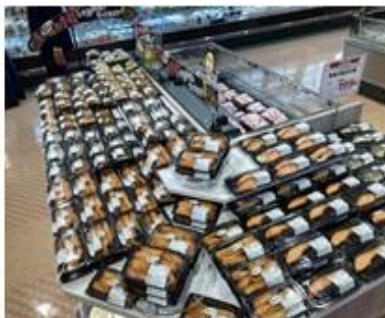
「焼魚・煮魚」は売場を新設しました