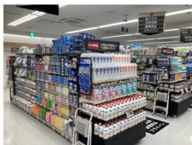
「ラップ・ホイル・ゴミ袋」コーナー