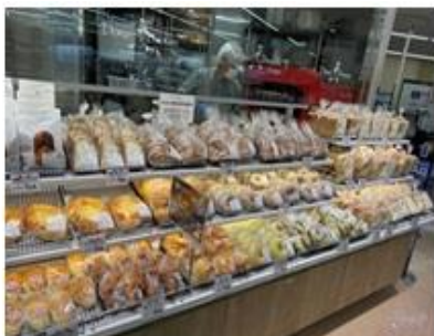
店内製造のパンが豊富に並びます