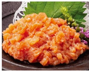
三陸産サーモン 刻み