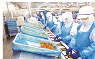
あんしんへの取り組み

独自の基準をクリアした工場だけを選定し、商品に適した品質管理を徹底。出荷時のクオリティを保つ効率の良い配送。さらに、環境に配慮した容器や持続可能な原材料の活用など、家族や地球にとって「あんしん」な毎日をつくるため、品質管理はもちろん、サステナブルにも積極的にチャレンジしていきます。