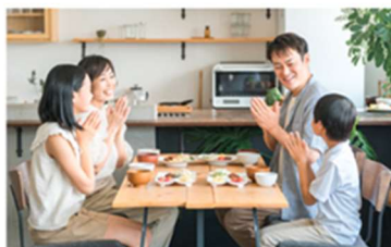
うれしいへの取り組み

「あったらいいな」が見つかる驚きと、価格以上の価値が得られる満足感。定番からトレンド、名店コラボなど、あらゆる世代の方が笑顔になるラインアップ。そんなさまざまな「うれしい」を提供するために、お客さまの声を取り入れ、その期待を超える商品の開発や発信に取り組んでいきます。