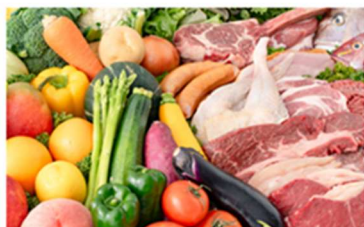
おいしいへの取り組み

原材料や製法に独自の商品開発基準を設定し、他社商品との比較調査、味覚調査などの取り組みを徹底。毎日食べても飽きない味わいや、ひと手間かけた本格感、彩りや香りなど、多種多様な「おいしい」を提供するために、一つひとつこだわりを追求していきます。