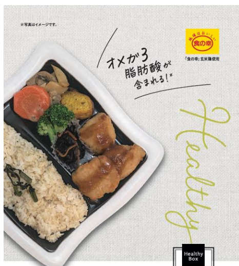
玄米鶏のおろし竜田弁当

西友は、お客さまの食のシーンやニーズに対応した付加価値の高い惣菜メニュー開発を通して、「西友が身近にあってよかった」と、お客さまに選んでいただける No.1 食品スーパーになることを目指してまいります。