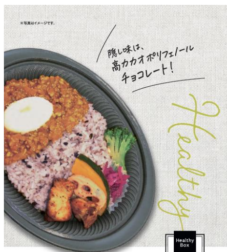
たんぱく質が摂れる！ トマトキーマカレー