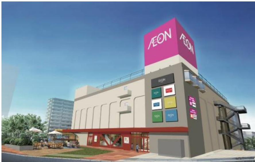
イオンスタイル鴨居 外観イメージ

イオンリテールは、5月28日（木）に「イオンスタイル鴨居」（横浜市緑区）を、6月4日（木）に「イオン海老名駅前店」（神奈川県海老名市）をオープンします。